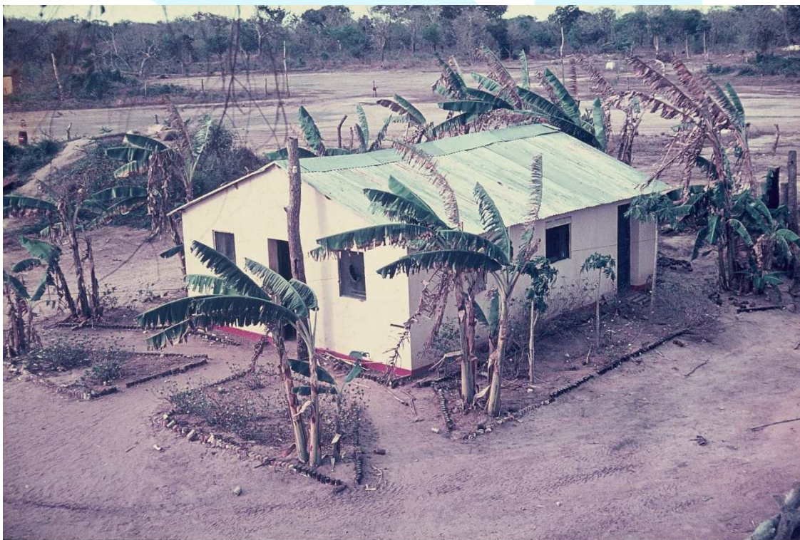
PARA O DESCANSO À SOMBRA DAS BANANEIRAS OU DOS ABRIGOS