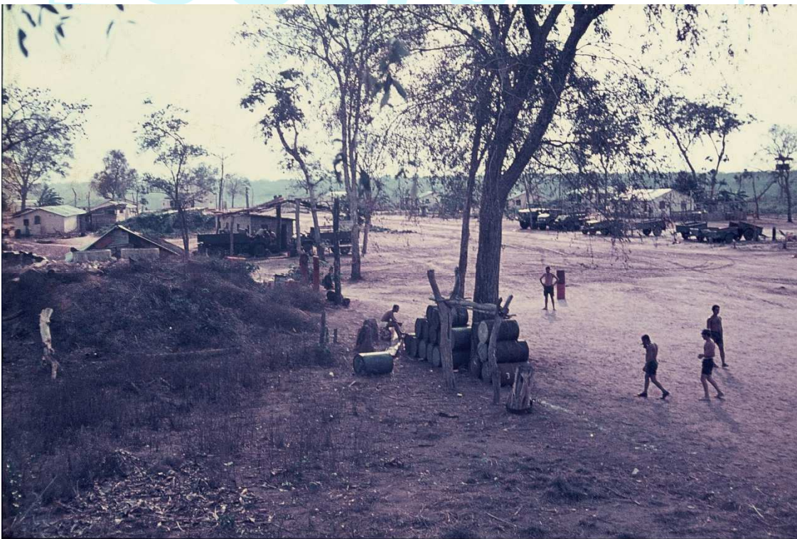
OFICINA DE MECÂNICA AUTO NA AVENIDA PRINCIPAL