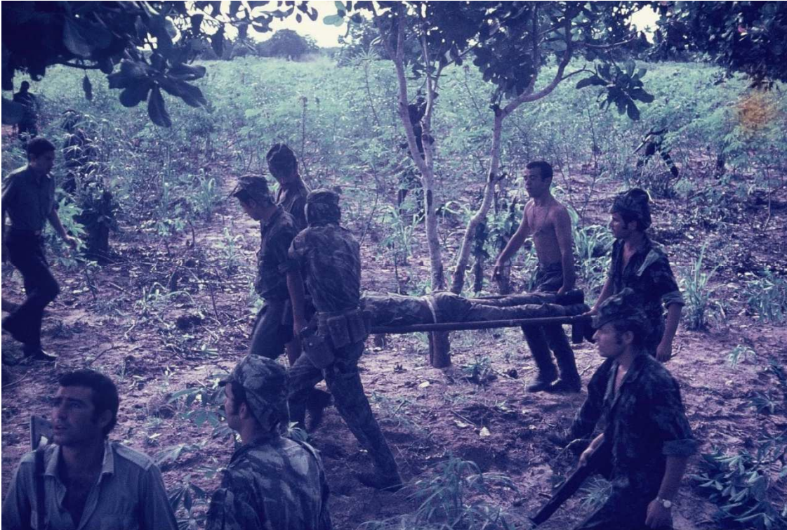
Quem limpa o sangue, Senhores que em mim mandam, que os jovens vertem na picada!