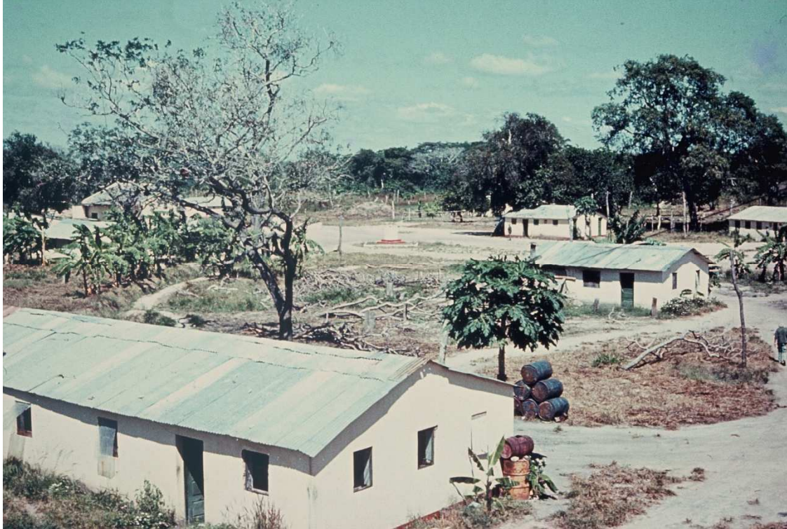
DORMITÓRIOS LADEADOS POR ALAMEDAS DESERTAS

No Chitolo tinha-se este conforto e qualidade de vida