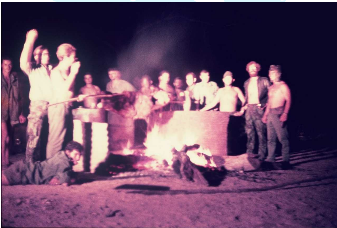
Quanto vinho, Senhores, deve um jovem beber para esquecer!