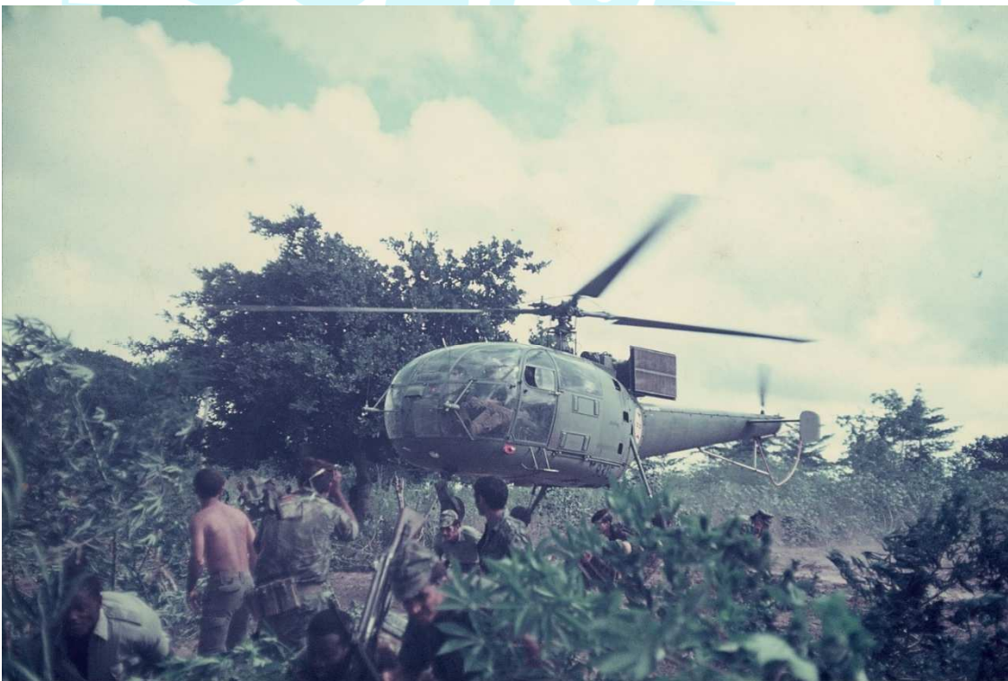
Até logo ou até amanhã, camarada.