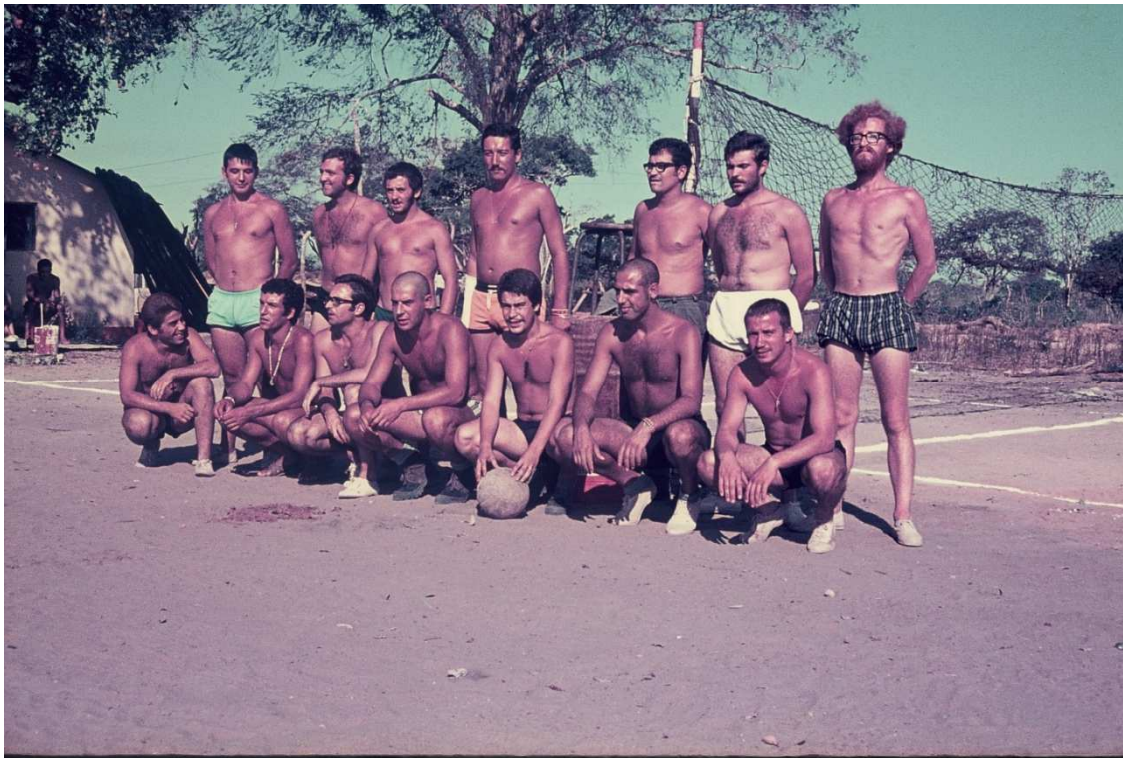
Nos intervalos do soar das armas, distrai-se o medo.