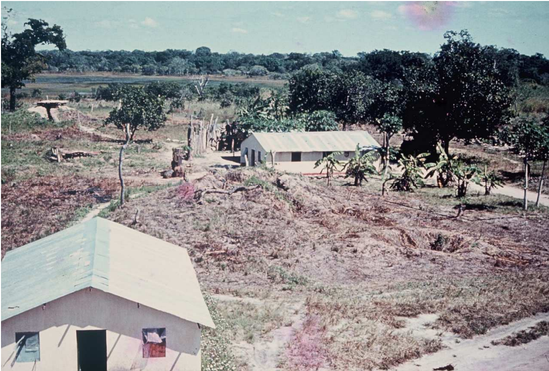
NO 2º PLANO: POISO OFICIAL DO 1º PELOTÃO (feito órfão em 11/11/70).