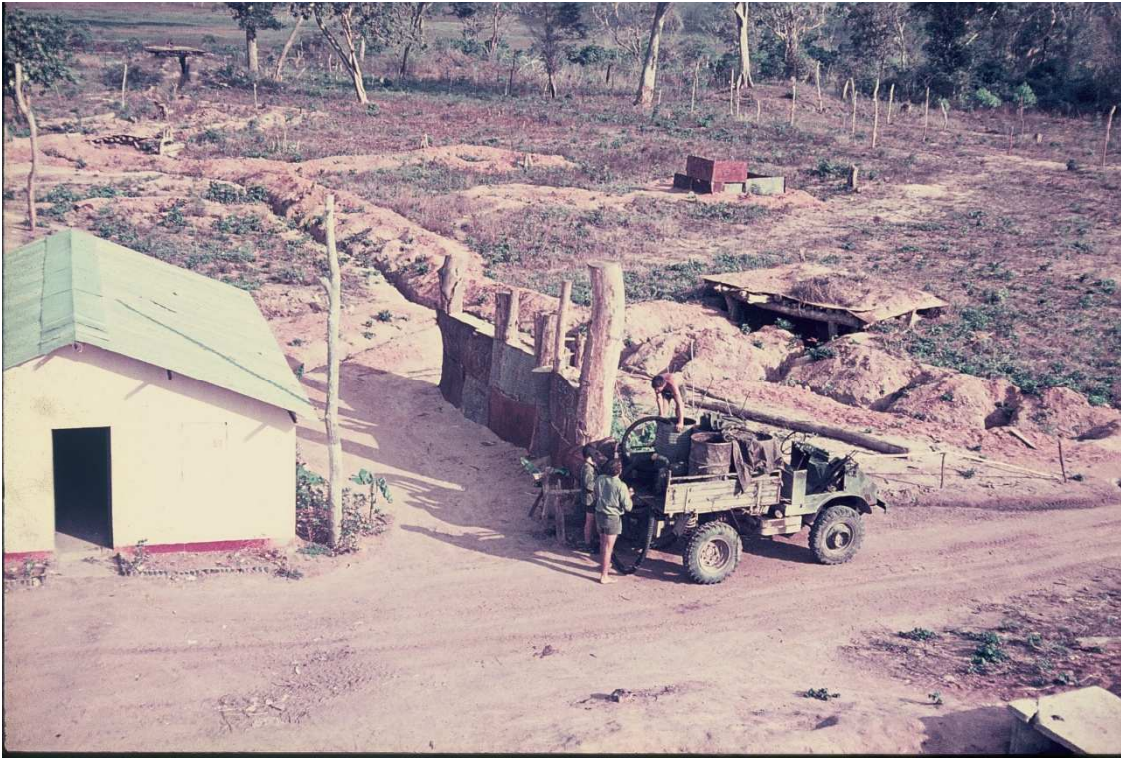
PISTA DE OBSTÁCULOS: PALIÇADA DE PROTEÇÃO, TRINCHEIRA DE CORRIDAS E ABRIGO DE PARAGEM (Hora de abastecimento domiciliário de água).