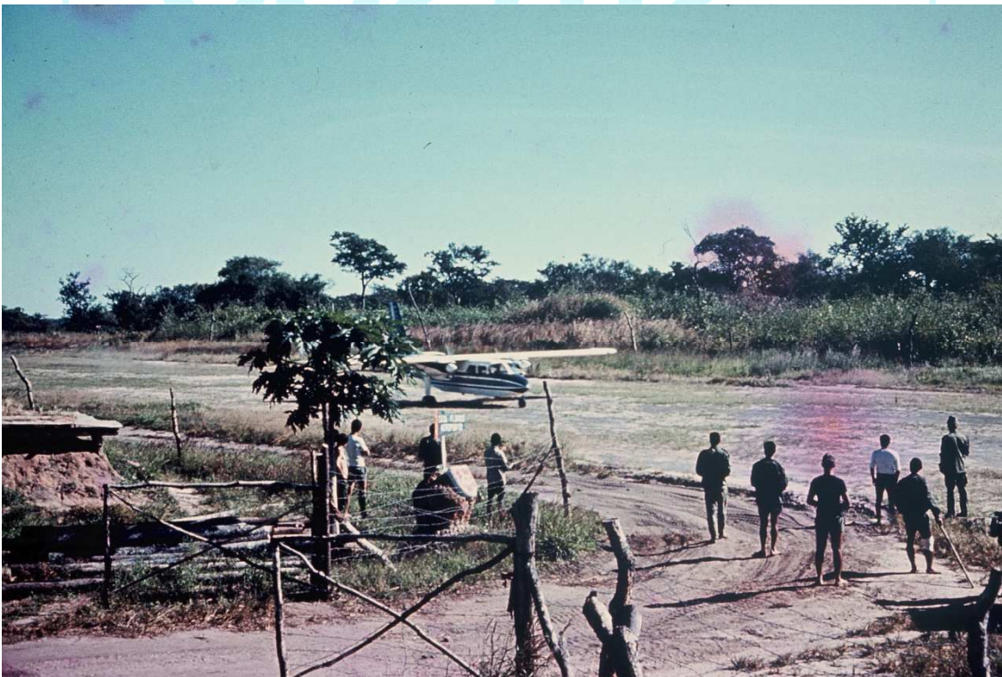
AUTO ESTRADA SUL COM PORTA DE SAÍDA DA CIDADE QUE LIGAVA AO AEROPORTO CAJÚ FLORIDO

“Pergunto ao vento que passa, notícias do meu país. O vento cala a desgraça, o vento nada me diz.”